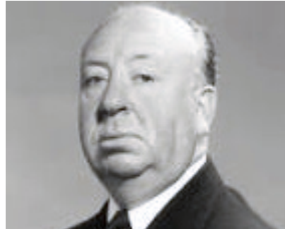
Alfred Hitchcock (1899-1980) Regista britannico Una delle personalità più importanti della storia del cinema