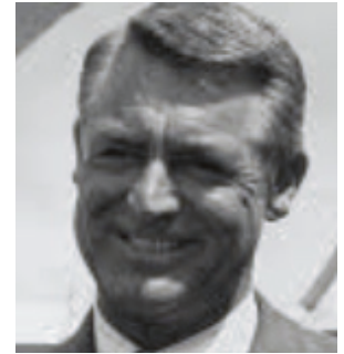
Cary Grant (1904-1996) Attore britannico Al secondo posto tra le più grandi star della storia del cinema