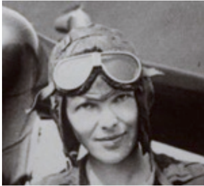
Amelia Earhart (1897-1939) Aviatrice statunitense Sorvolò l'atlantico in solitaria nel 1932