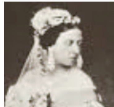
Regina Vittoria (1819-1901) Sovrana del Regno Unito Troviamo la sua efigie sul primo francobollo al mondo (Black Penny)