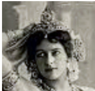
Mata Hari (1876-1917) Danzatrice e spia olandese Fucilata con l'accusa di spionaggio durante la prima guerra mondiale