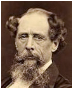
Charles Dickens (1812-1870) Scrittore britannico Tra i suoi più famosi scritti Oliver Twist e Canto di Natale