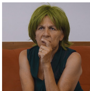
MAMMA DI ROCCO