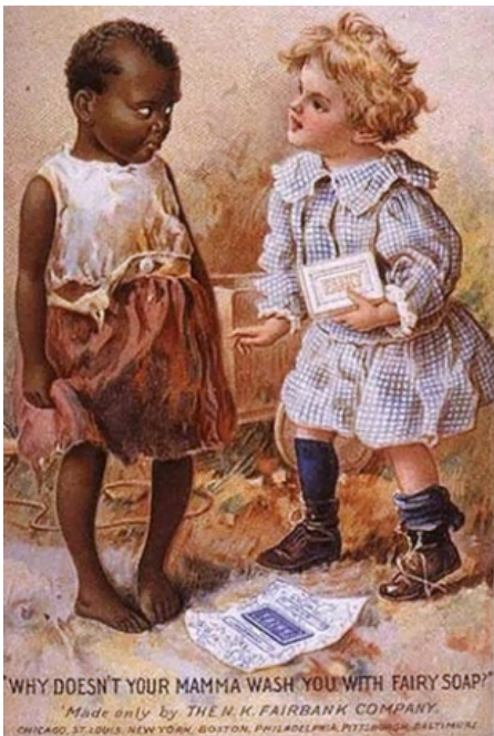
La bambina chiede all'altra perché la mamma non la lava con il sapone