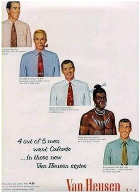
L'uomo di colore è visto come un selvaggio